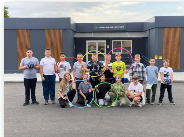
с.Богданівка, Київська область