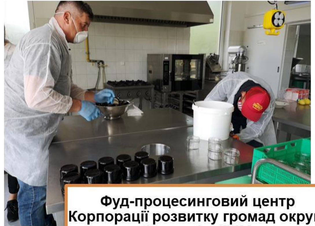
Фуд-процесинговий центр Корпорації розвитку громад округу Франклін, США