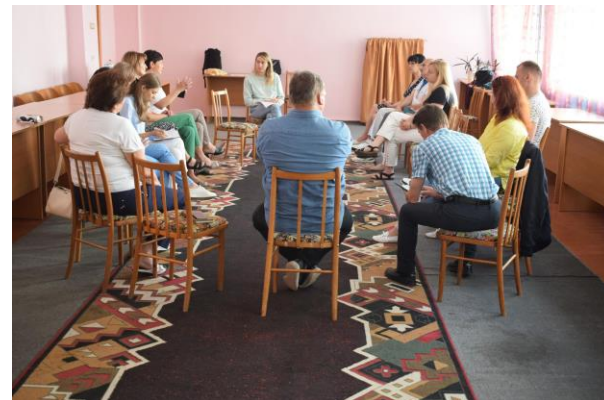
Фокус-група, ВПО_Горохівська ТГ