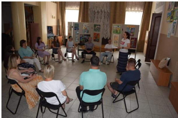
Фокус-група, місцеві жителі_Володимирська ТГ