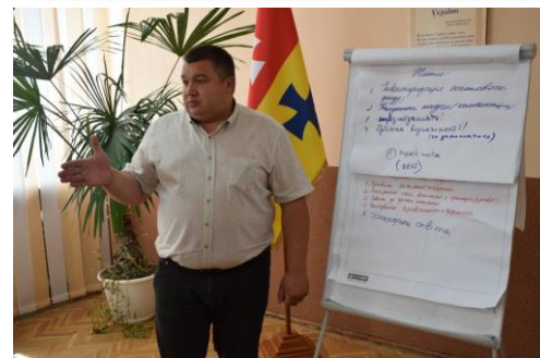
Діалогова зустріч _Рожищенська ТГ