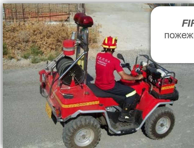
FIREXPRESS пожежні-добровольці в Греції

Саме з цієї причини обладнання Firexpress обирають пожежні добровольці та професіонали у Греції, Іспанії, Данії, Великій Британії, Тайланді, Китаї та багатьох інших країнах світу. З 2020 року це обладнання доступне для українських пожежних служб.