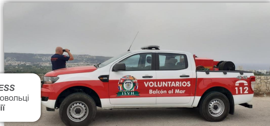
FIREXPRESS пожежні-добровольці в Іспанії